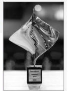
... про творчий спадок

1 «Золота дзига» – українська національна кінопремія, заснована 2017 року Українською кіноакадемією з метою популяризації національного кінематографа й видатних досягнень тих, хто сумлінно працює над створенням